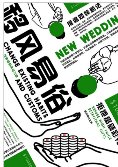
《移风易俗》海报设计 学生：郑佳栋 指导教师：刘飞