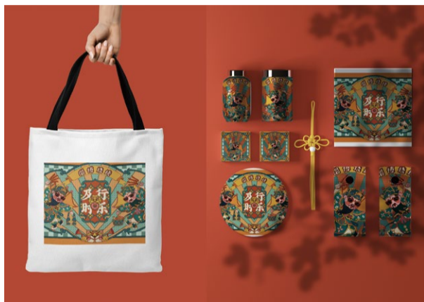
《淄博烧烤系列文创产品设计》 学生：马乐乐、王一诺 指导教师：王庶