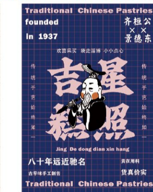
《景德镇节节糕升系列包装》 学生：肖梦姍、方燕雯 指导教师：王庶