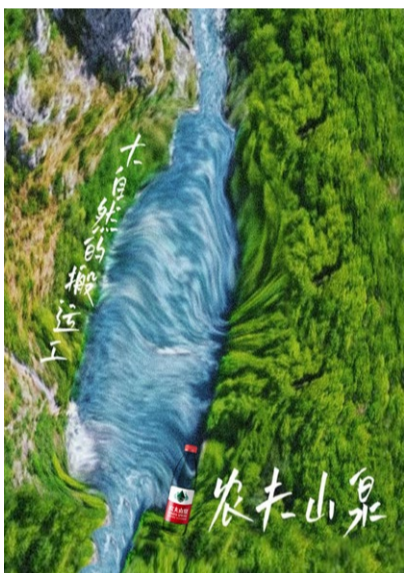
《农夫山泉 大自然的搬运工》海报设计 学生：尹晓洁 指导教师：翟倩倩