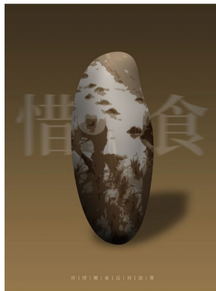
《惜食》海报设计 学生：张友诚 指导教师：刘飞