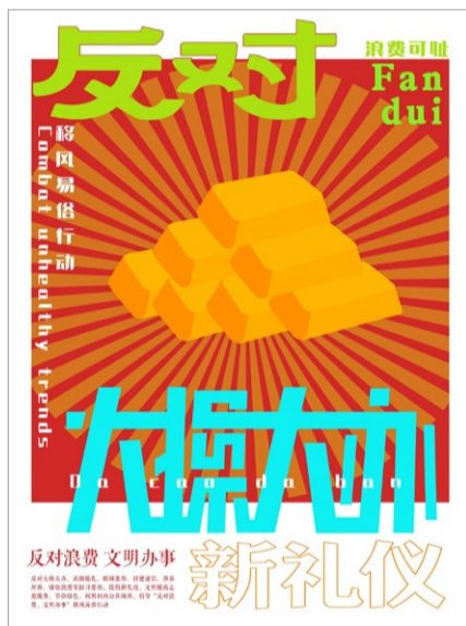
《反对大操大办》海报设计 学生：宫玥 指导老师：刘飞